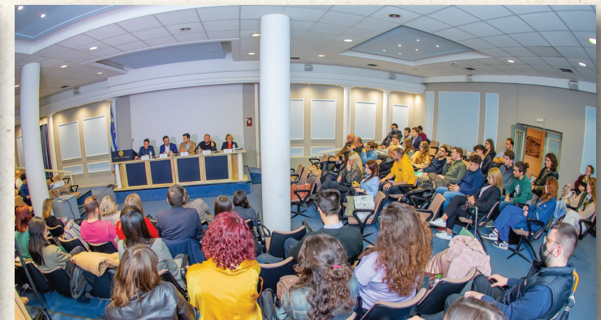
Το κοινό παρακολουθεί με ενδιαφέρον την πολιτική αντιπαράθεση μεταξύ των εκπροσώπων των πολιτικών κομμάτων.