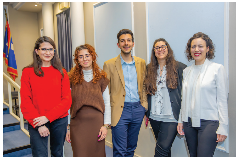
Τα άρθρα απηχούν τις προσωπικές απόψεις των συντακτών τους και δεν υποθετούνται απαραίτητα από το σύνολο της συντακτικής ομάδας.