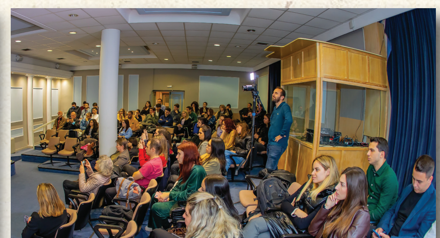
Σε εξέλιξη η συζήτηση στο Αμφιθέατρο «Αντώνης Τρίτσης» του Οργανισμού Πολιτισμού, Αθλητισμού και Νεολαίας του Δήμου Αθηναίων.